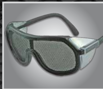
Lente de malla