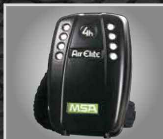
Equipo de Rescate Air Elite