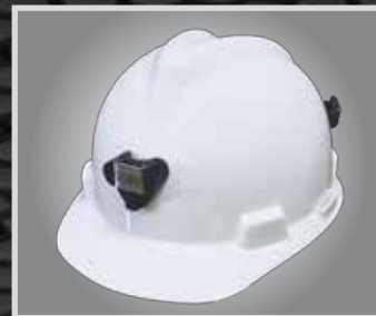
Nuevo porta lámpara