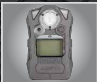
Detector ALTAIR 2X de CO